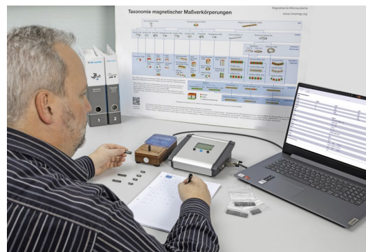
Abb. 1: ELSOMA C10 Flussdichtemessgerät bei der Wareneingangsprüfung von Motormagneten

In diesem Beitrag werden die gebräuchlichsten Messverfahren für die magnetischen Eigenschaften von Dauermagneten vorgestellt sowie ihre Vorteile und Grenzen erläutert. Dabei liegt der Fokus auf produktionsnahen Verfahren und Geräten, die bei der Wareneingangs- oder Wareneingangsprüfung bzw. bei In-Line Prüfungen benutzt werden können.