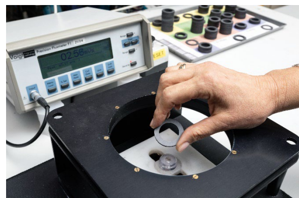
Abb. 2: Fluxmeter mit Helmholtzspule

Bei der Wahl des Messverfahrens müssen mehrere Faktoren berücksichtigt werden. Für die Entwicklung und Prüfung unter Laborbedingungen erhöhen Geräte mit verbesserter Genauigkeit die Größenordnung der Genauigkeit. Für die Seriencharakterisierung sind zerstörungsfreie Messverfahren wirtschaftlicher und werden eher eingesetzt. Bei der Qualitätskontrolle in der Massenproduktion sind wirtschaftliche Faktoren (d. h. die Kosten als eine Funktion des Durchsatzes und der Messzeit pro Magnet) und die erforderliche Genauigkeit von besonderer Wichtigkeit. Auf Basis der relativen Bedeutung dieser Faktoren während des Lebenszyklus des Produktes kommen sehr unterschiedliche Verfahren und Geräte zum Einsatz [2, 3, 4].