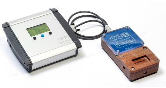
Abb. 4: ELSOMA C10 Flussdichtemessgerät mit Messvorrichtung

Der Bedarf an magnetischen Winkelmess-Systemen bzw. magnetischen Drehgebern nimmt kontinuierlich zu. Somit steigt auch der Bedarf an schneller, präziser Messtechnik zur Überprüfung und Sicherung der Qualität der eingesetzten zwei- und mehrpoligen Ring- und Zylindermagneten.