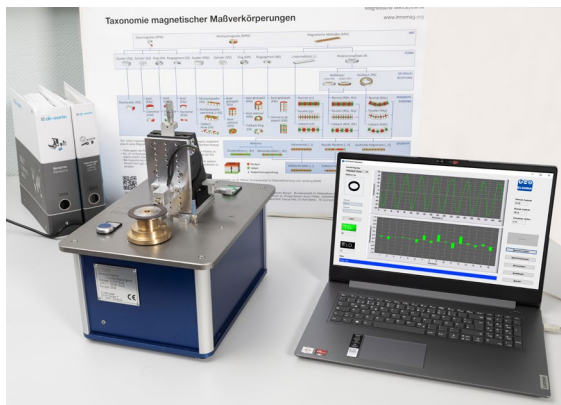
Abb. 5: ELSOMA A05 winkelbasiertes Flussdichtemessgerät

Dabei muss die Flussdichte des Magnetfelds an mehreren kodierten Spuren präzise, produktiv und kosteneffektiv erfasst werden. Hier kommt das CE-gekennzeichnete Flussdichtemessgerät ELSOMA A05 für winkelbasierte Messungen zum Einsatz. Das Gerät verfügt über einen speziellen, hochempfindlichen und präzisen 3D-Sensorchip zur Erfassung von allen drei magnetischen Feldkomponenten mit nur einer Messung (Abb. 5).