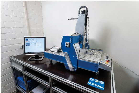
Abb. 3: 3D magnetische Mapper

Für die Messung der magnetischen Feldstärke und der magnetischen Induktion ist ein Flussdichtemessgerät bzw. Feldstärkenmessgerät mit Hallsonde seit längerem das am häufigsten eingesetzte Gerät. Die Verwendung von Helmholtzspulen ( Abb. 2 ) zur Messung der Remanenz in offenen Kreisen und des magnetischen Moments macht dieses Gerät in Labors und bei der Eingangskontrolle von Magneten allgegenwärtig [5, 6]. Wenn die Homogenität und die 3D-Komponenten des Magnetfelds erfasst werden müssen, kommen 3D-Magnetmapper zum Einsatz ( Abb. 3 ) [7]. Solche Geräte jedoch sind eher für den Laboreinsatz konzipiert und sollen unter eng kontrollierten Umgebungsbedingungen eingesetzt werden. Für produktionsnahe Messungen geht es eher um Robustheit, Flexibilität und Wirtschaftlichkeit, was zu dem Einsatz von anderen Messgerätypen führt.