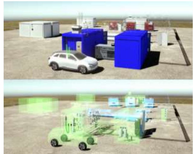
Abbildung 5: Digitaler Zwilling mit 3D-Umgebung und Prozesssimulation

Die Dateninfrastruktur des Reallabors ermöglicht es einen Digitalen Zwilling der Anlage zu erzeugen. Dieser stellt in einer 3D-Umgebung einen digitalen Zugang zur Gesamtanlage bereit (Abbildung 5). Basierend auf umfangreichen Datensätzen aus dem spezifischen IT/OT-Backbone können somit weitreichende Prozesssimulationen durchgeführt werden.