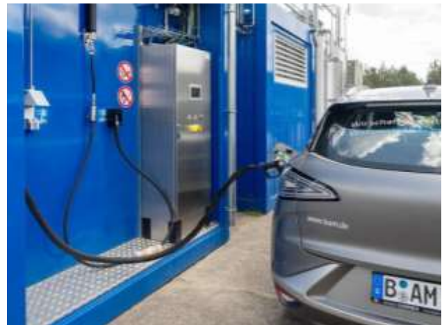
Abbildung 1: Betankung des BAM-Wasserstofffahrzeugs im gegenwärtigen Aufbau des Reallabors

Der in der Anlage eingesetzte Wasserstoff kann mittels einer eigenen Elektrolyseeinheit (bis zu 24 kg H2 /Tag) vor Ort unter Einsatz einer lokalen PV-Anlage erzeugt und direkt bei Mitteldruck (200 bar) gespeichert werden. Alternativ kann dieser Speicher auch von einem Wasserstofftrailer versorgt werden. Mittels Kompressors wird der Wasserstoff im Hochdruckspeicher auf 930 bar weiter verdichtet. Die nachgeschaltete Kühleinheit konditioniert den Wasserstoff derart, dass Fahrzeuge bei 350 und 700 bar über den Dispenser betankt werden können. Das Reallabor ist in modularer Containerbauweise realisiert worden.