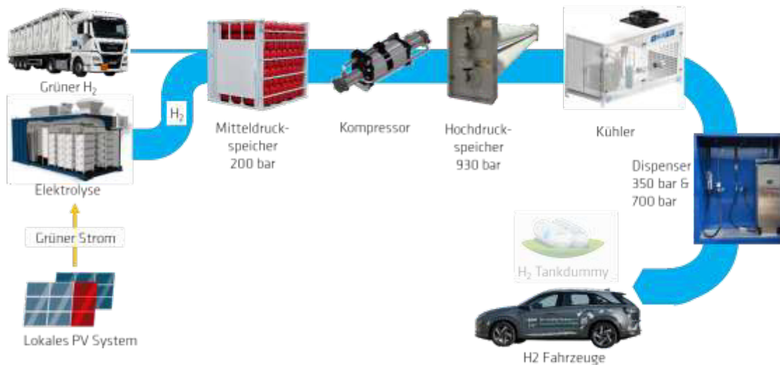
Abbildung 2: Hauptkomponenten und Wertschöpfungskette des Reallabors Wasserstofftankstelle.

Die Prozessüberwachung, Dispenser, Elektrolyse, Speicher und Kompressor sind in separaten Containern untergebracht und können damit bedarfsgerecht auf dem Testgelände Technische Sicherheit (TTS) der BAM aufgestellt werden (siehe Abbildung 3).